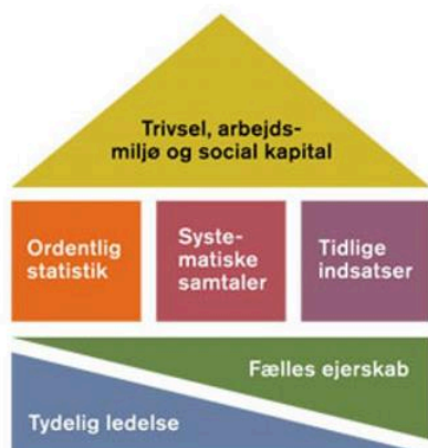
Figur 1. En kur mod sygefravær, KL og Forhandlingsfællesskabet, 2014

område, som omfatter stress, depression, psykosomatiske diagnoser og fravær af private årsager. HR-staben er en aktiv sparringspartner i forhold til dialog om konkrete handlingsplaner til at nedbringe sygefraværet.