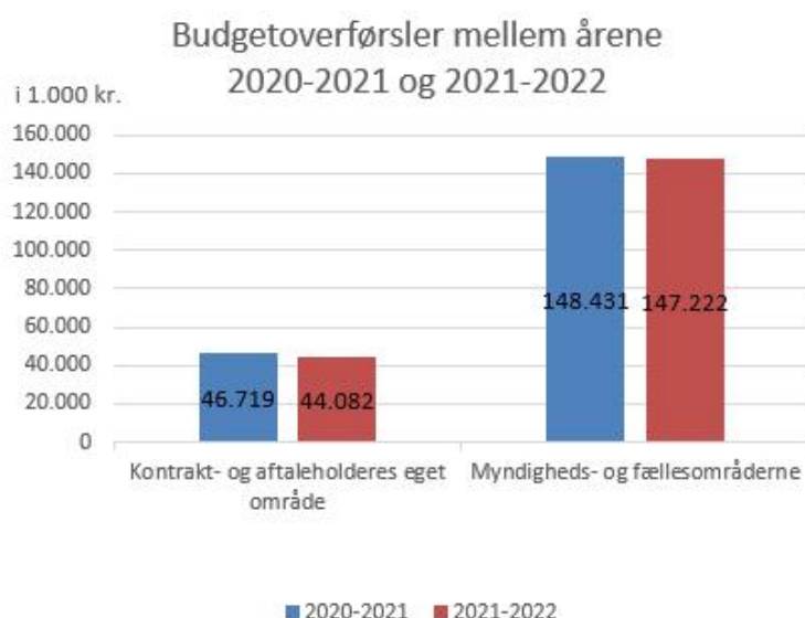
Figur 1 Budgetoverførsler mellem årene (2020 til 2021 og 2021 til 2022)

Ud af overførslerne på aftaleholderes (administrationens) egne områder, som udgør 20,1 mio. kr., er de 9,1 mio. kr. disponeret til finansiering af øget behov for administrative ressourcer bl.a. som følge af "Klar til fremtiden", ansættelse af flere planmedarbejdere mv. Dette er uddybet i sag om 1. budgetopfølgning 2022.